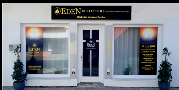
EDEN Filiale Rudersdorf für Rudersdorf und Umgebung