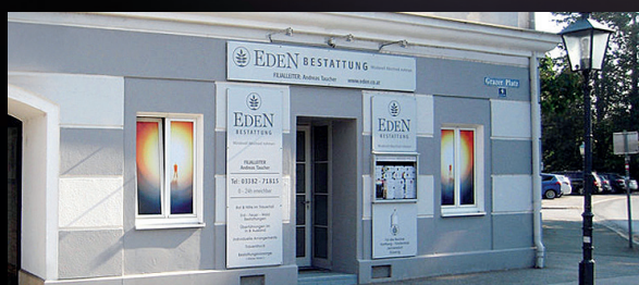
EDEN Filiale Fürstenfeld für Fürstenfeld und Umgebung