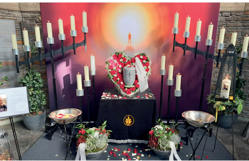
Urnenaufbahrung System EDEN