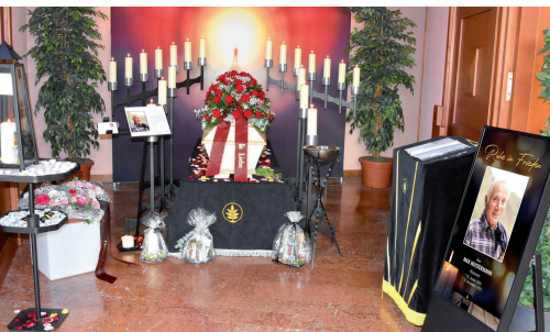
Sargaufbahrung System EDEN